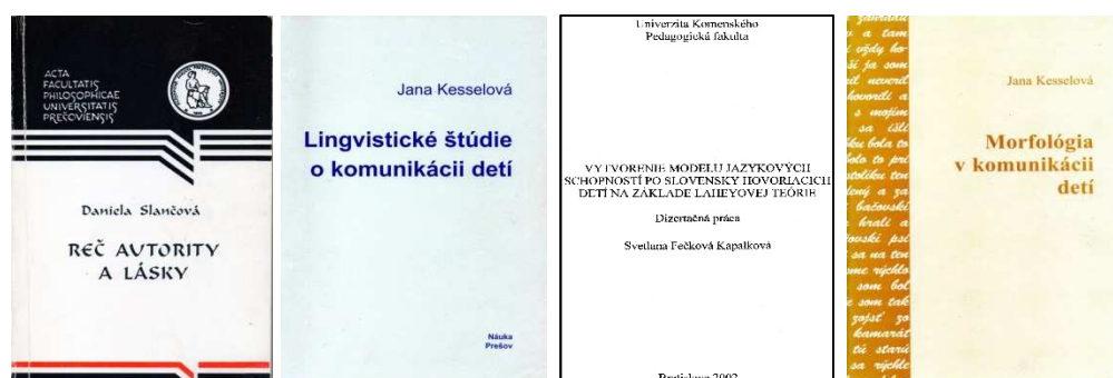
Obrázok 1 Obálky knižných publikácií a dizertácie z rokov 1999 – 2003