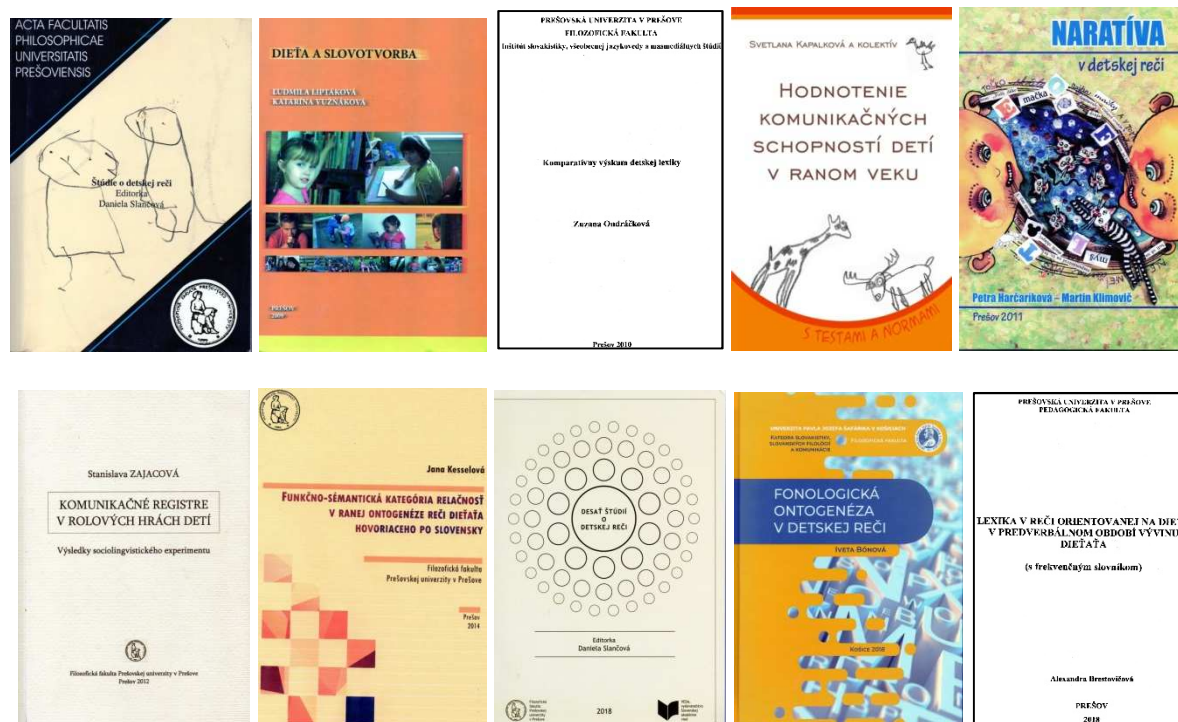
Obrázok 2 Obálky knižných publikácií z rokov 2008 – 2018